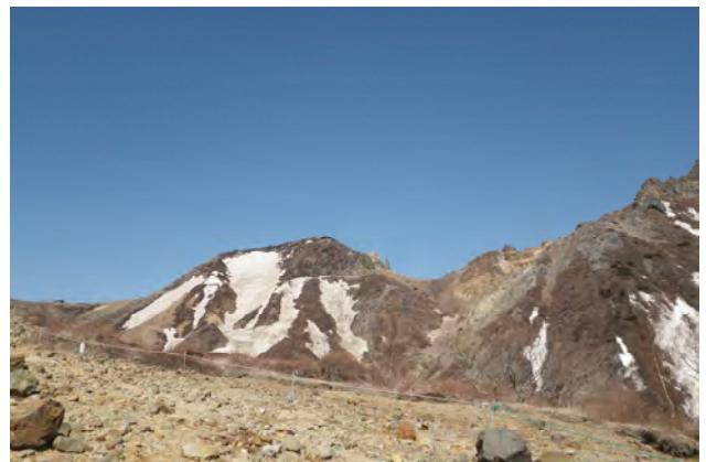
残念ですが剣ヶ峰はおあすけです