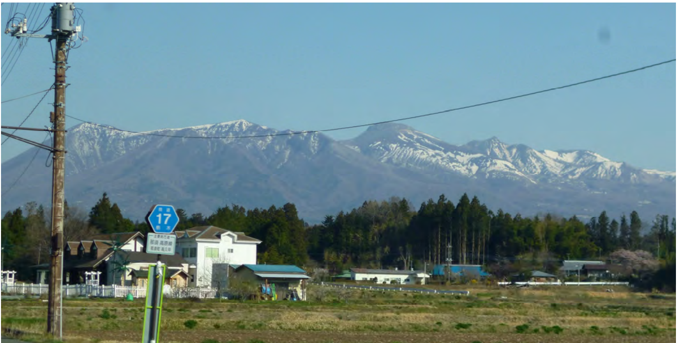
本日の那須連山 これで山頂まで辿りつけないのだから山は難しいなあ～！！