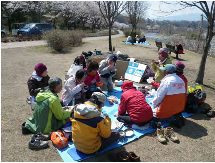
おいしくけんちん汁をいただきました