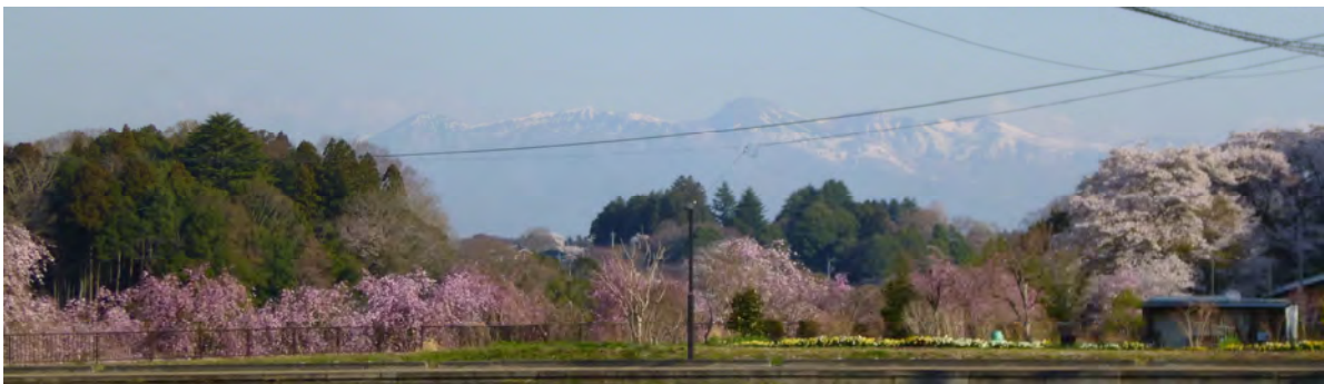
黒羽支所の前の満開の桜。 向こうに那須連山が見える