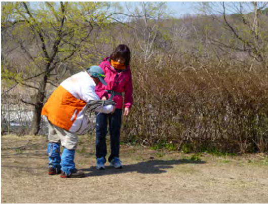
相変わらず女性にやさしい先生