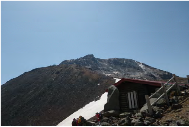
今年の神事はこの小屋の中で