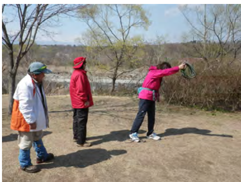
早速ザイルワークの訓練

12時峠の茶屋駐車場到着。ここでコンパの予定でしたが、強風と寒さのため場所を鳥の目公園（黒磯）に移動して実施することになりました。