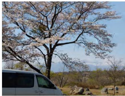
鳥の目公園の桜も満開