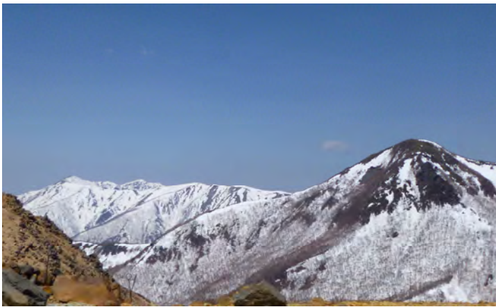
強風で見ることができなかった人のために 本日の三倉・大倉・流石

が有りませんが、自然に見事な姿勢で突破しました。小屋の中に入り温度計を見ると零下1℃でした。どおりで寒いし手がかじかんでいました。風の影響を考えるともっともっと体感温度は低かったのでしょうか。 計画では、剣ヶ峰の山頂で今年の登山の無事をいのる開山の儀を行う予定でしたが、安全第一峰の茶屋の避難小屋をお借りしての実施となりました。テーブルの上に持参した登山用具やリュックを積み上げ、お祓いをし祝詞をあげてお神酒を頂きました。ところが、中身はなぜかお茶けでした。少しそこでおつまみ等を頂きながら休憩をして下山となりました。追い風とはいえ油断禁物です。途中の雪渓ではザイルで安全確保をして下山しました。