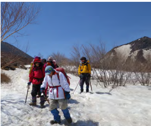
雪を見ると元気がでる先生