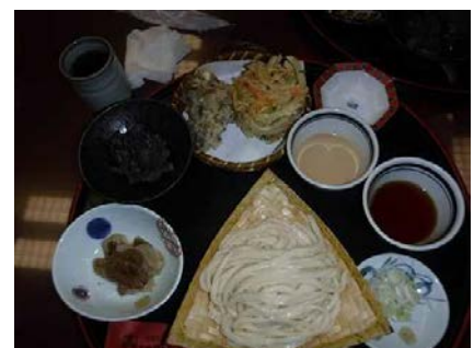
水沢うどん 田丸屋 1,700円也