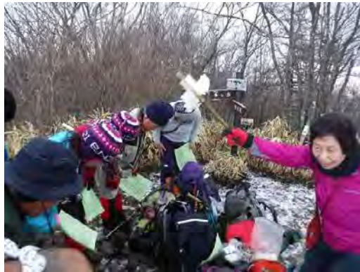
修祓の儀 掃部ヶ岳山頂にて