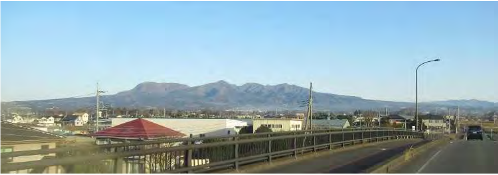
車窓より赤城山を望む