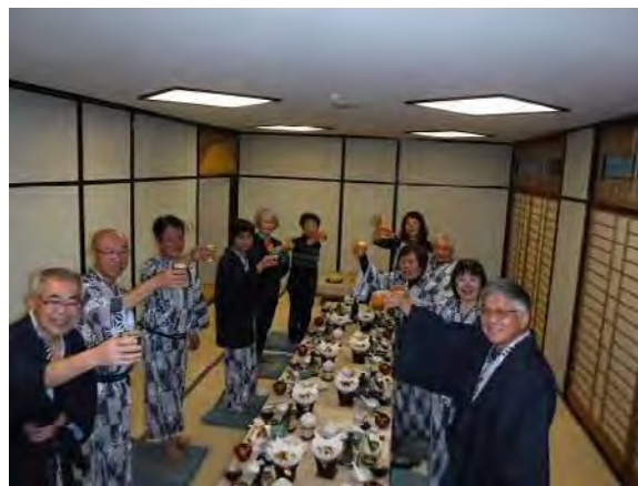
今年一年間ご苦労様でした。カンパ〜イ！

生懸命歩く、途中「富士山」が見えるスポットがある。残念ながらこの日は見る事ができませんでした。中央には、浅間山、「谷川連峰」が見える。アイゼンをはいての下山は本当に大変で私は、前の人から遅れを取り、3時30分にやっと下れた。車が待っていてくれたので助かりました。