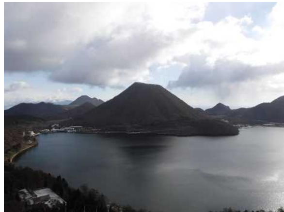
榛名湖と榛名富士