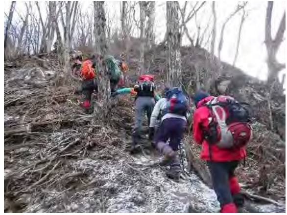
2日目スタートです

前には、榛名湖、榛名富士が見え絶景だ。下をのぞくと足が竦むほどの高さです。 息を切らせながら、(10時15分着)。ここで、山仕舞の神事を行った。祝詞奏上をしている間、他の登山客が2人いた。その人達は、「何を思ったかな」と感じました。(11時30分)下山初め途中、分岐から階段はないルートへ、一箇所大きな岩あり、少し怖かった。ここは、私は、一度来たことがあ