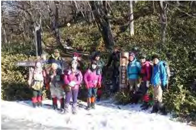
登山口から雪あり

野崎6時30分発天気晴れ、参加者12名、車2台、途中通行止あり、コース変更の為少し遅れて、赤城山ビジターセンター到着。 身支度をして、9時15分に発。途中車の中から見た山は、全く雪が無く、「ああ、良かったと思いま