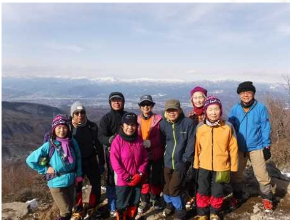
噂どおりの絶景でした

付近の一带の大きな成層火山につけられた名であり、「赤城山」と名前の山頂は、存在しない。一般的には、最高峰の黒檜山をさしている。再びアイゼンを付け、12時40分下山初め、岩場の急な坂、苦戦しながら一