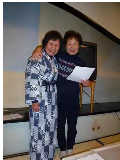
今回のCLとSL。お世話になりました