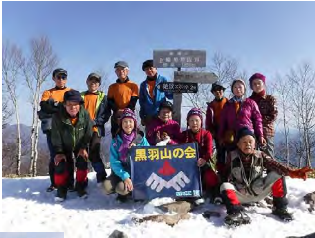
赤城山（黒檜山）山頂にて

氷も厚くなり、ワカサギ釣りが盛んになるようだ。11時40分黒檜山 くろひやま 目指しひたすら歩く。途中、黒檜大神という石碑がある。更に少しで、黒檜山山頂（1,828m）。12時着。ここで