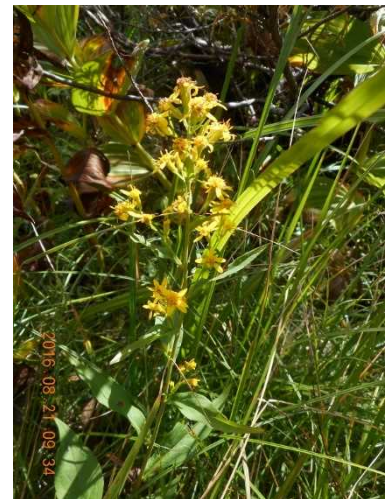
アキノキリンソウ

んなにたくさんのお出 会いがあったことに感謝 し感謝し、木道脇にたつ た一輪だけ咲き残って いたチングルマと、我が メンバーの田代湿原観 察研究班(仮称)の4名 が弘法大師堂で分かれ、 残る8名は次なる帝釈 山へと出発した。