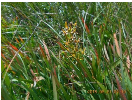
キンコウカ いつもは見頃なのに・・・