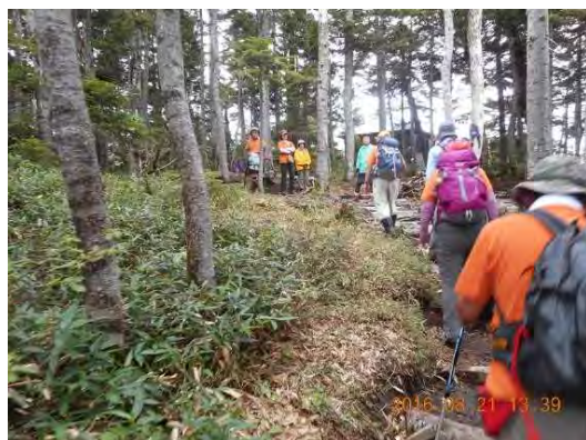
田代湿原研究隊と合流