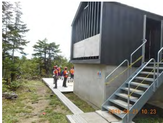
とっても綺麗なトイレでした