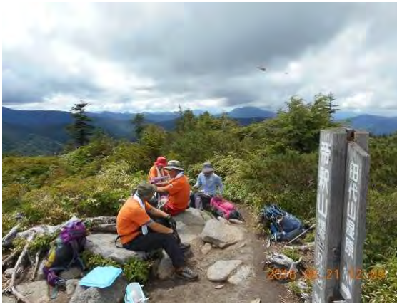
もう一つの山 帝釈山にて

度の展望であったが、このころには北東を中心に雲が広がってきて、釈迦が岳方向、日光連山方向、尾瀬方向の山々ははっきりと姿を現していて、各山々の説明が指導者からありとても参考になった。雲の接近が早くなってきたため、早々の下山となった。 午後1:40弘法大師堂で、田代湿原観察研究班の4名と合流し、12名全員がそろい、時折麓から吹き